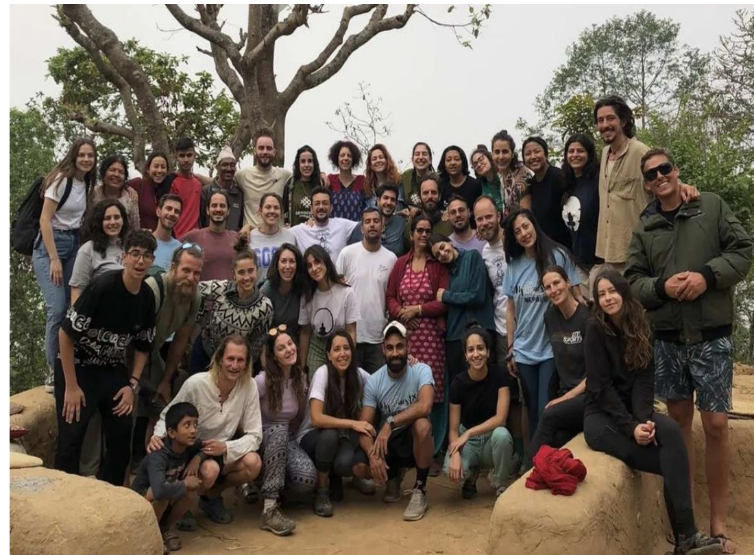
Εθελοντικό Ταξίδι στο Νεπάλ, 2023