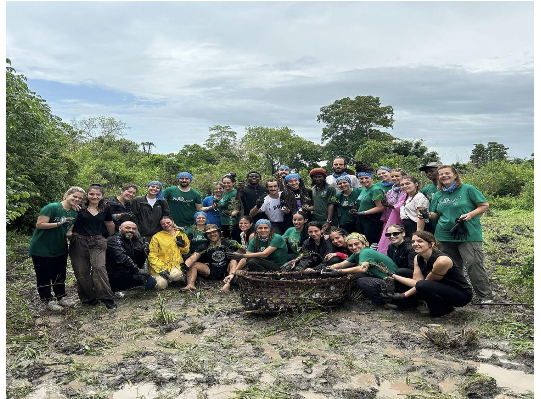
Εθελοντικό Ταξίδι στην Τανζανία, 2023