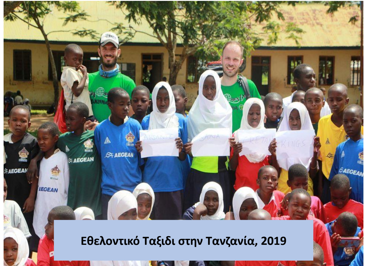
Εθελοντικό Ταξίδι στην Τανζανία, 2019

Τα αποτελέσματα από τα project μας ήταν να μοιράσουμε πολλά χαμόγελα στα παιδιά του χωριού. Βοηθήσαμε με τον δικό μας τρόπο να ωθήσουμε τα παιδιά να συνεχίσουν στην εκπαίδευση.