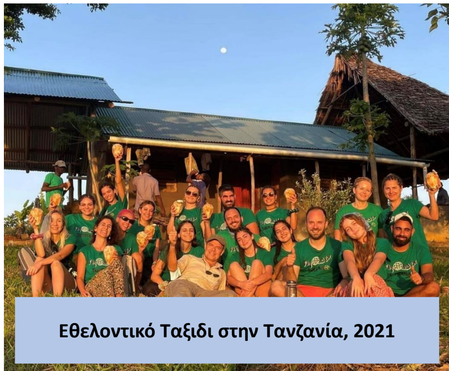
Εθελοντικό Ταξίδι στην Τανζανία, 2021

Η ανάπτυξη των Backpack Brothers ήρθε μέσα από την συνεργασία με το Wheeling2help, από την οποία είχαμε την δυνατότητα να ηγηθούμε των δικών μας γκρουπ στις χώρες της Τανζανίας, του Νεπάλ και της Ουγκάντας , δίνοντας έτσι την ευκαιρία στους δικούς μας εθελοντές να ζήσουν την εμπειρία των εθελοντικών ταξιδιών.