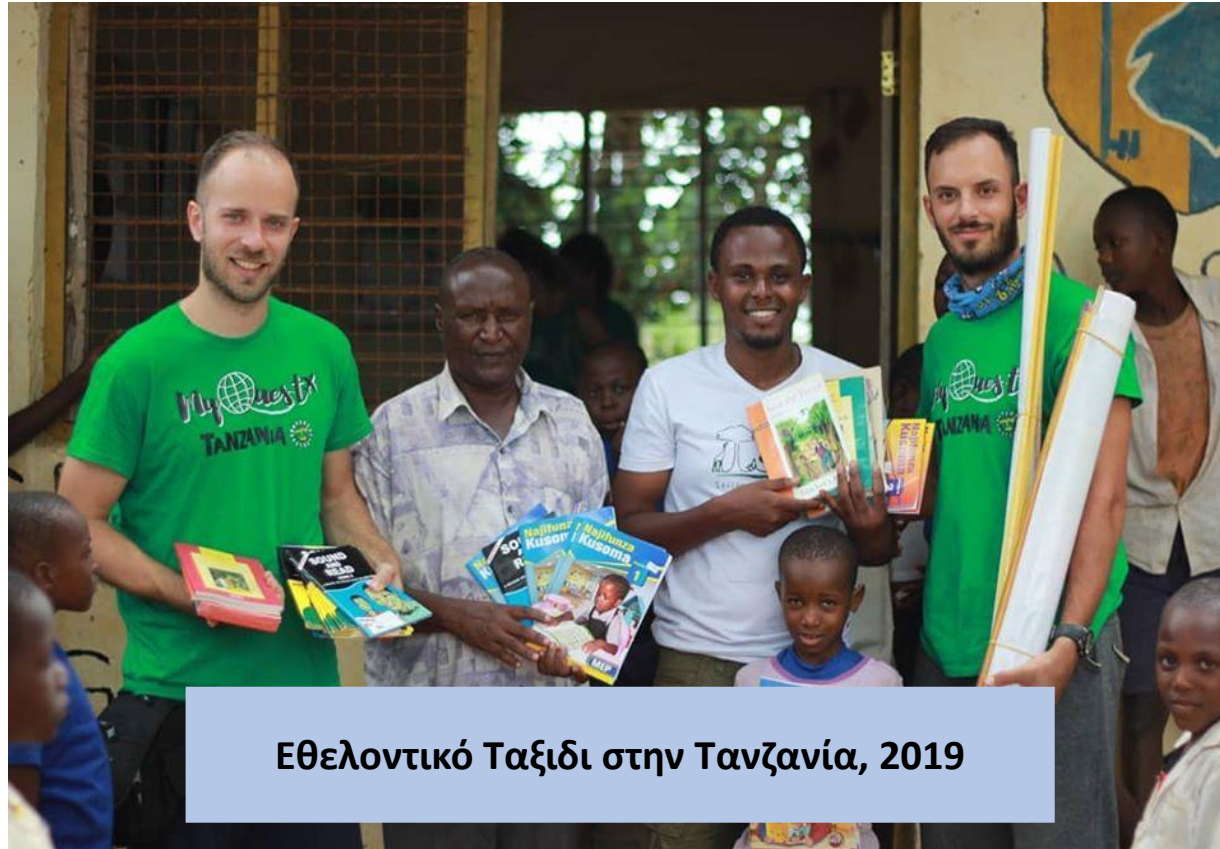
Εθελοντικό Ταξίδι στην Τανζανία, 2019

Για αυτό τον λόγο διεξήχθησαν ακόμη δύο πρότζεκτ από εμάς για την ενίσχυση της τοπικής κοινότητας.