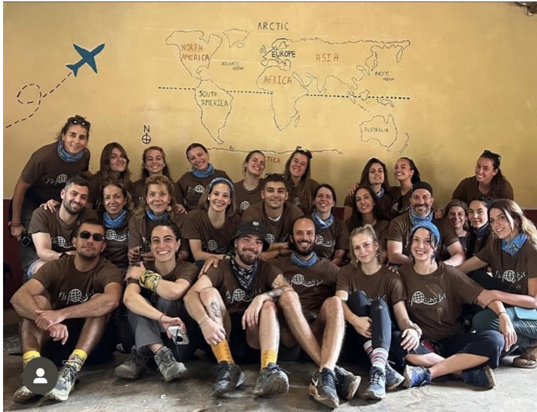
Εθελοντικό Ταξίδι στην Ουγκάντα, 2023