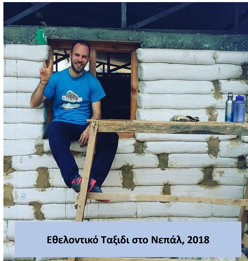
Εθελοντικό Ταξίδι στο Νεπάλ, 2018

Οι εθελοντές που συμμετείχαν στο πρότζεκτ, βοήθησαν στην ανοικοδόμηση των σπιτιών για τους κατοίκους του χωριού!