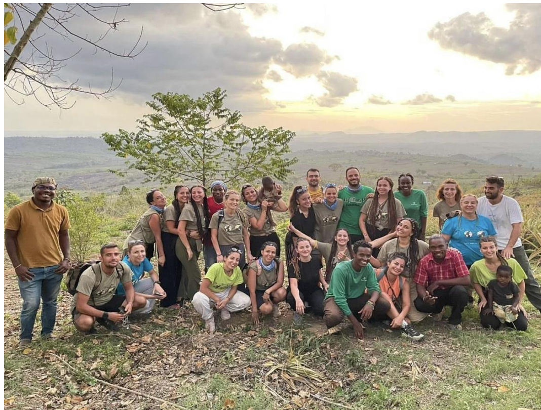
Εθελοντικό Ταξίδι στην Τανζανία, 2022